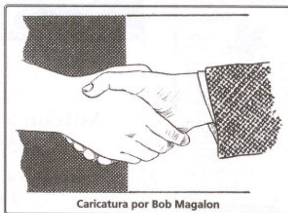
Caricatura por Bob Magalon

Tomado de Las flores del bien, Phil Bosmans